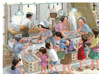
6月/ハエ取りリボン