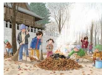
12月/焚き火で焼き芋