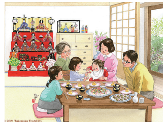
3月/ひな祭りのご馳走